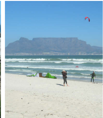
Ein Strand bei Kapstadt