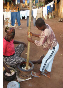
Zubereiten von Fufu