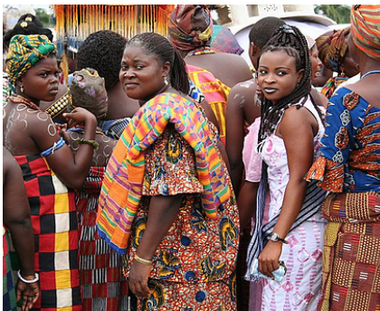
Menschen in Kente-Kleidungs-Festival

Viele Menschen in Ghana tragen bunte Tücher oder Stoffe mit buntem Muster als Kleidung. Der traditionelle Stoff heißt Kente und wird auf Teppichwebstühlen hergestellt. Traditionell besteht die Kleidung der Männer aus einem Stück Kente-Stoff. Frauen hingegen tragen meist ein Tuch um die Hüfte gewickelt und ein maßgeschneidertes Oberteil dazu. Ein drittes Tuch um die Schulter oder als Transportmittel für die Kleinkinder gehört zur traditionellen Kleidung der Frau.