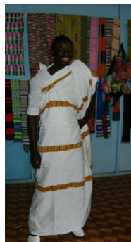
Mann in Kente-Stoff eingehüllt