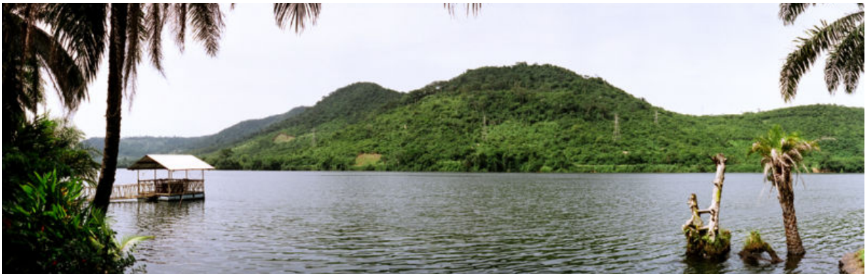
Der Fluss Volta

Im Westen Afrikas liegt die Republik Ghana. Vor einiger Zeit gehörte Ghana als Kolonie zu Großbritannien. Das Land grenzt an die anderen afrikanischen Länder Togo, Burkina Faso, die Elfenbeinküste und an den atlantischen Ozean. Im Südosten Ghanas liegt der Volta-See. Er ist der größte künstlich angelegte Stausee der Welt und dient der Stromerzeugung durch ein großes Wasserkraftwerk. Die Hauptstadt Ghanas heißt Accra und liegt am atlantischen Ozean. Früher nannte man Ghana auch die Goldküste. Der Name verrät es schon: ein wichtiger Bodenschatz Ghanas ist das Gold. Daneben ist Ghana der zweitgrößte Kakaoproduzent der Welt.