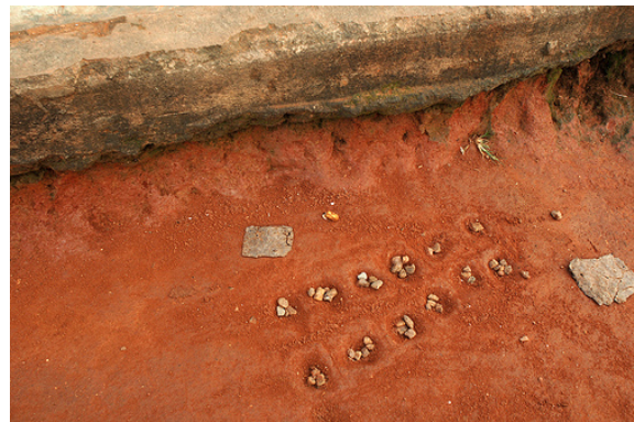
Oware im Sand

Das Steine Spiel, das die Kinder aus Ghana spielen, erfordert Konzentration und Koordination, da sie gleichzeitig spielen und singen. Probiert aus, ob ihr das auch so gut schafft wie die Kinder in dem Video. So geht's: