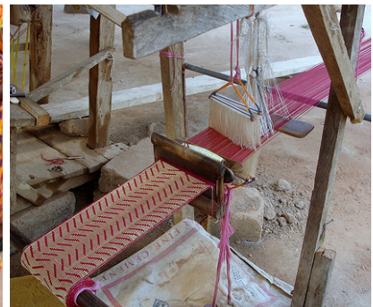
Webstuhl für Kente-Stoffe